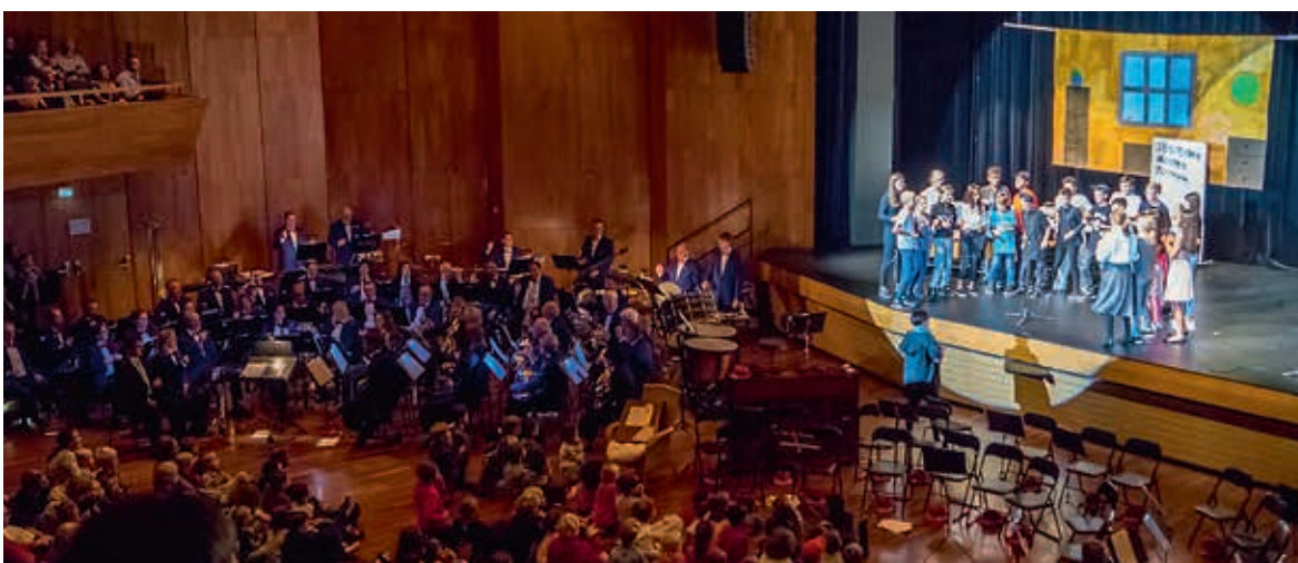
Das Gemeinschaftsprojekt der Harmoniemusik Helvetia Horgen mit der Schule Rotweg war ein voller Erfolg.

D'avantage d'informations sur le prix d'encouragement des musiques de jeunes et sur la possibilité de soumettre des projets pour le prix 2020 sous www.jugendmusik.ch